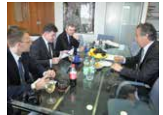
Minister Lajčák si so záujmom prezrel bulletin dokumentujúci činnosť života v Nitre.