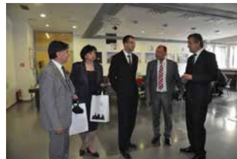
Delegácia navštívila v sprievode primátora Dvonča klientske centrum a na druhej fotografii – primátor Užic odovzdal dar – obraz primátorovi Dvončovi ako prejav vďaky za vrelé prijatie na mestskom úrade.