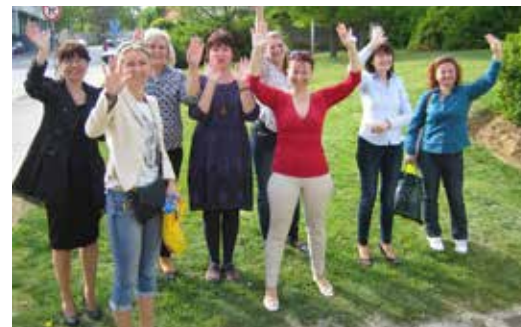
Učiteľky MŠ z Nitry a Kroměříža sa za tie roky už dobre poznajú.

„V piatok 24. apríla, ktorý sme nazvali Skvelý deň, prišli autobusom aj rodičia s deťmi a pedagógovia z družobných MŠ z Kroměříža, s ktorými sme navštívili Slovenské poľnohospodárske múzeum na Agrokomplexe, hrad a park na Sihoti, kde sa deti mohli voľne pohrať. Jeden otecko z Kroměříža prišiel do Nitry na bicykli a domov už išiel spolu aj so svojou rodinou