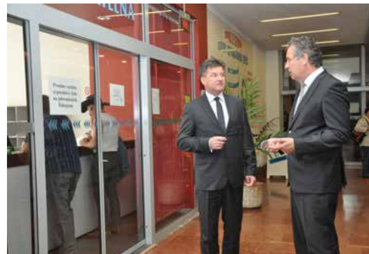
Minister Lajčák navštívil v sprievode primátora Jozefa Dvonča klientske centrum na MsÚ v Nitre a potom rokoval s primátorom Jozefom Dvončom.